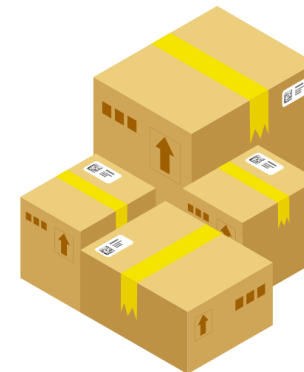
Региональный распределительный центр (Организация оптовой торговли/Медицинская организация)