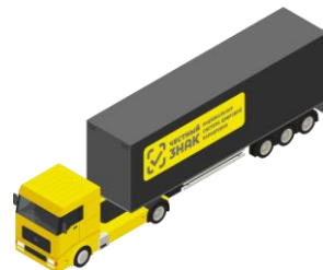
Логистические услуги ООО "Иммунотехнологии"

Отгрузка (включая схемы оприходования) по МДЛП